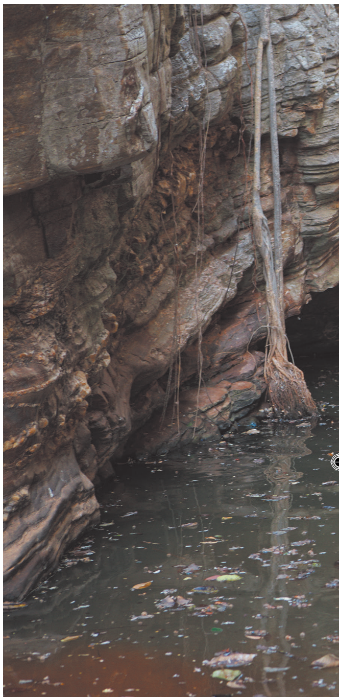
Antônio Bispo dos Santos, Quilombo Sumidouro, município de Queimada Nova/ PI.